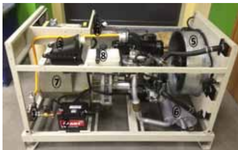
Рис. Генераторная установка ФАС-OZP/VD