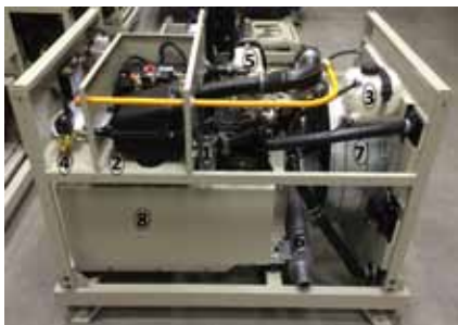
Рис. Генераторная установка ФАС-OZP/V

Для осуществления контроля и управления выходной мощностью и защиты от возможных сбоев в работе установка оснащена контроллером (подробная информация о настройке контроллера – в разделе 9).