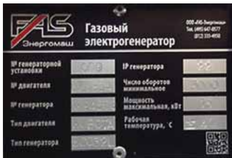
Рис. Табличка-шильда паспортных данных генераторной установки

Каждая генераторная установка имеет идентификационный номер, указанные на фирменном ярлыке-шильде (см. рис.), прикрепленном к основанию. Эта шильда содержит информацию о дате изготовления, напряжении, токе, мощности в кВА и кВт, частоте, коэффициенте мощности и массе генераторной установки. Эти данные необходимы для оформления заказов на запасные части, обоснования гарантии и заявок на сервисное обслуживание.